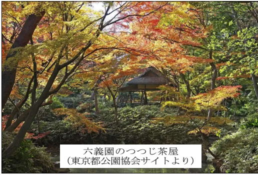
六義園のつつじ茶屋